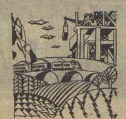
Рис. А. РЯБИНИНА

Октябрата 3-го класса «В» школы № 1, с. Сунтар.